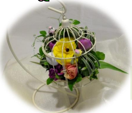
3月 イースターアレンジ