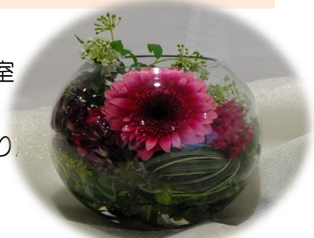
4月 まん丸ガラスのSpring arrangement