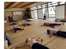
終了後の至福の時間